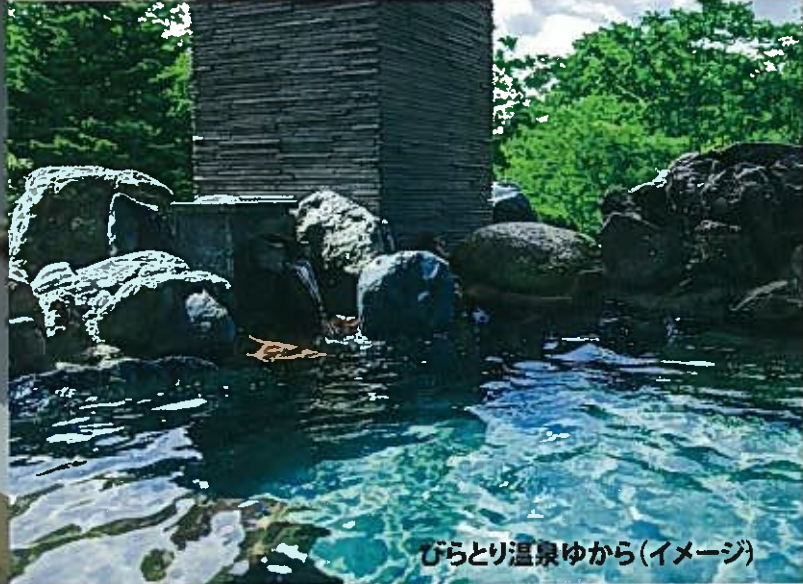
びらとり温泉ゆから(イメージ)