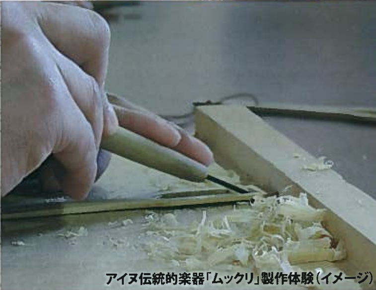
アイヌ伝統的楽器「ムックリ」製作体験(イメージ)