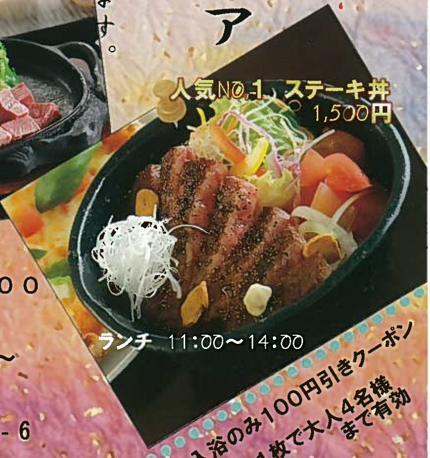
人気NO.1 ステーキ丼 1,500円