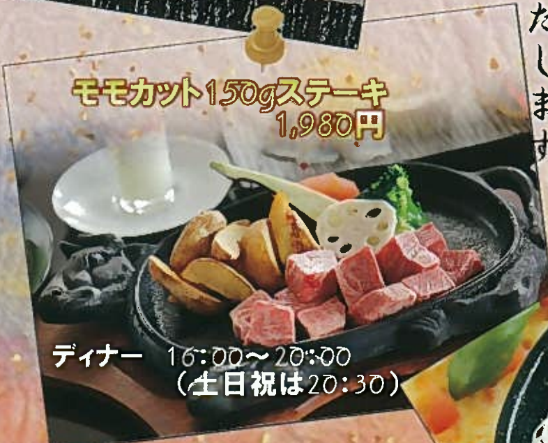
モモカット150gステーキ 1,980円